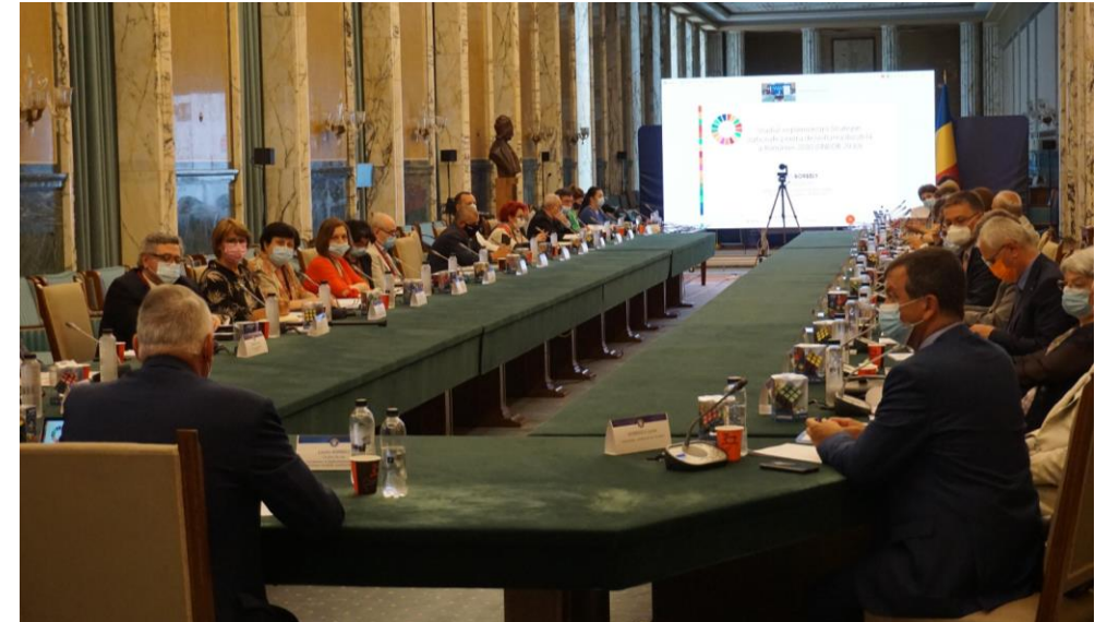
Foto: Prima ședință CCDD, Palatul Victoria, București, 20.07.2020