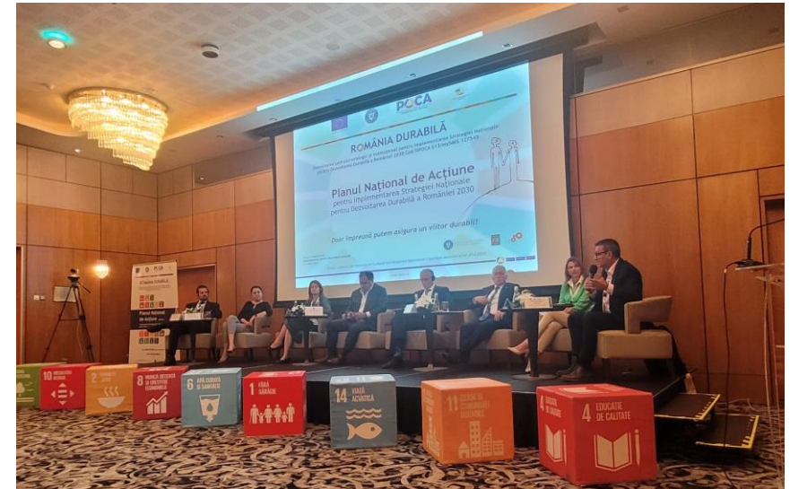
Foto: Conferința internațională de lansare a PNA, București, 23.06.2022