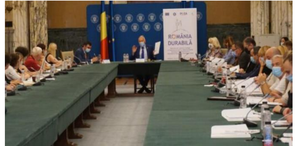
Foto: Prima ședință a grupurilor reunite pentru elaborarea PNA, Palatul Victoria, București, 19.07.2021