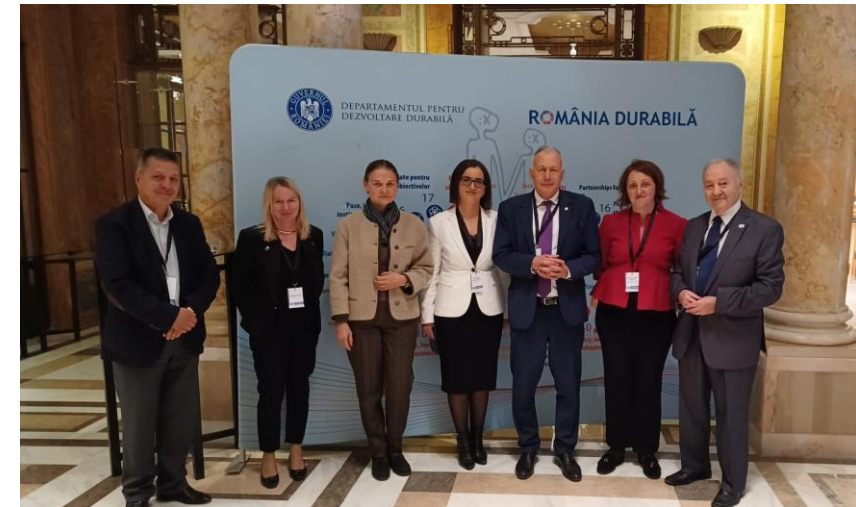
Foto: Participare la ESDN Conference 2022, București, 4-5.10.2022