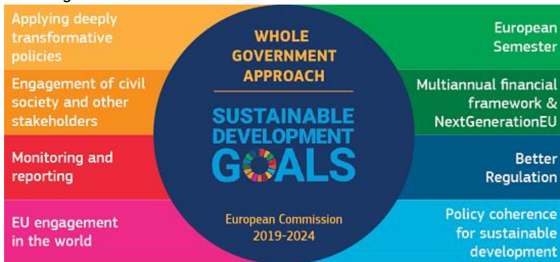
Fig.5. abordarea "pangubernamentală" a Comisiei pentru punerea în aplicare a ODD-urilor Sursa: Sursa:Comisia Europeană sdgs_web2_0.png (europa.eu)

Cu toate acestea la acest moment există o nouă abordare globală sau "pangubernamentală" adoptată de noua Comisie în ceea ce privește punerea în aplicare a obiectivelor de dezvoltare durabilă cuprinzând mai multe componente așa cum sunt ilustrate în fig.5: