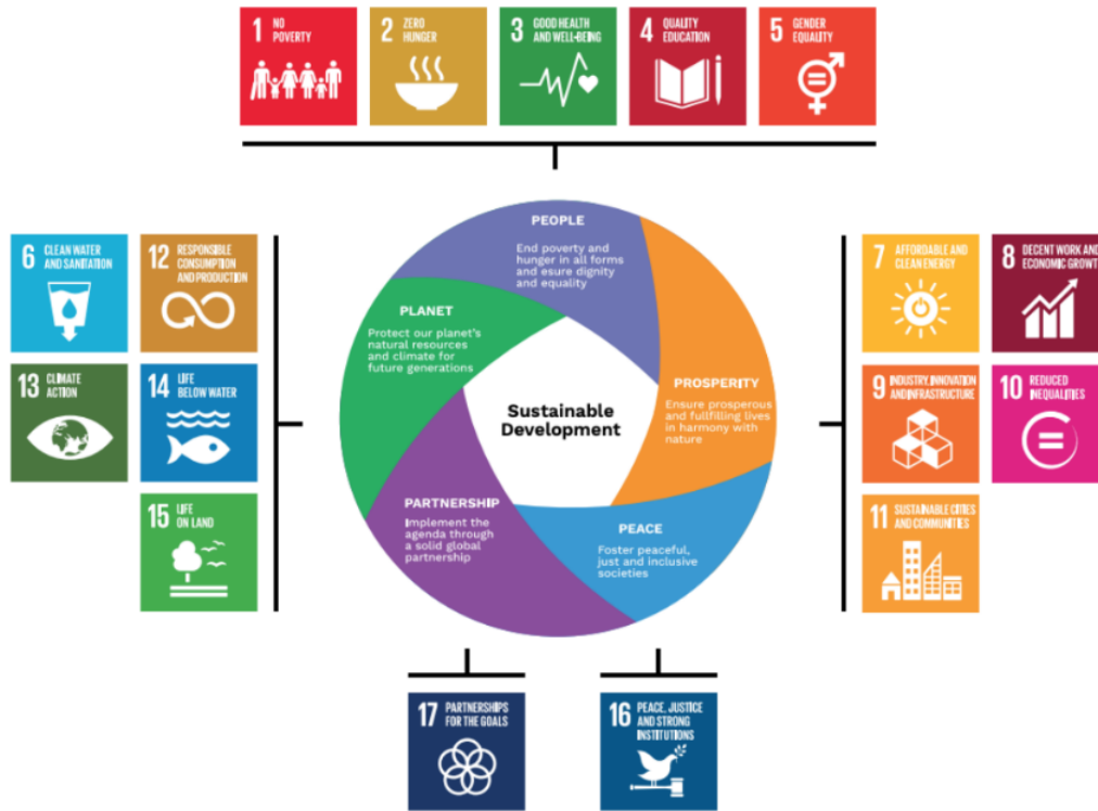
Fig.3. Pilonii Agendei 2030 și legătura cu ODD-urile