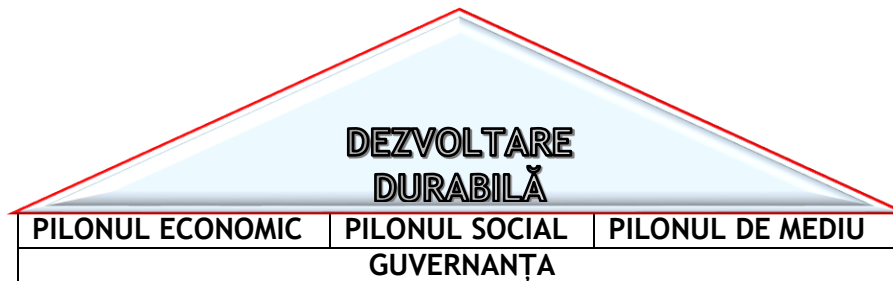
Fig. 2 Pilonii dezvoltării durabile

Așadar, dezvoltarea durabilă înseamnă mai mult decât protecția mediului, deoarece necesită schimbări culturale pe termen lung, o condiție prealabilă a acestora fiind adaptabilitatea statului/oamenilor/culturii. Astfel, pe lângă capacitatea de adaptare este imperios necesar ca decidenții să susțină intens un proces de inovare în termeni de idei, tehnologii, acțiuni, întrucât problemele existente în secolul XXI nu pot fi rezolvate cu practici și mijloace tradiționale. În acest sens decidenții se pot concentra pe: